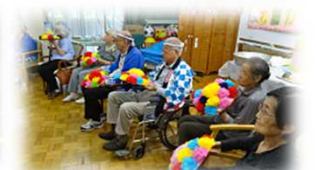
職員による、有隣太鼓